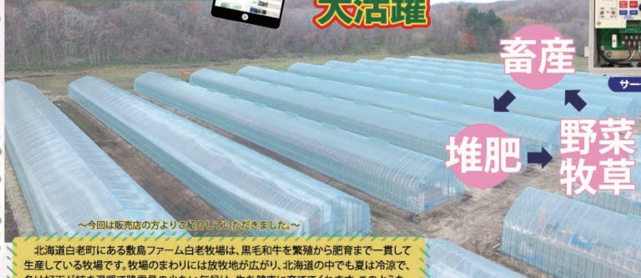
～今回は販売店の方よりご紹介いただきました。～

北海道白老町にある敷島ファーム白老牧場は、黒毛和牛を繁殖から肥育まで一貫して生産している牧場です。牧場のまわりには放牧地が広がり、北海道の中でも夏は冷涼で、冬は好天が続く温暖で降雪量の少ない気候は、牛を健康に育ててくれます。このような気候は、野菜をストレスなく育てるのに最適な場所でもあります。