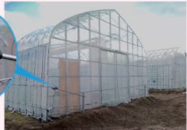
サーモ8（1日を最大8つに区切り、各時間帯ごとに温度設定が可能です。）とトランス盤で巻上げ換気に加え、内張りフィルムの開閉も自動でおこないます。