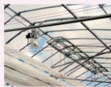
電動カンキットN制御盤でトビテン（天窓）も自動開閉