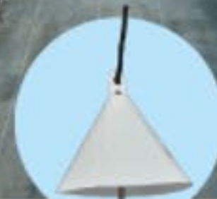
付属の温度センサー