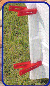
ピンチで止めます。